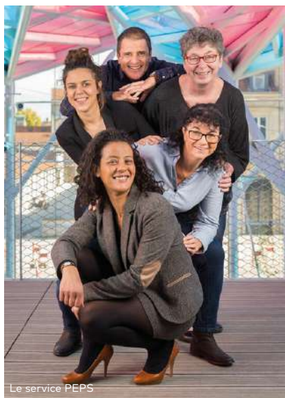
Le service PEPS

L'accompagnement de l'étudiant dans son développement personnel et son orientation professionnelle est un axe stratégique et historique de l'école.