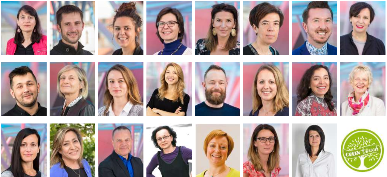
Les 24 membres du comité de pilotage RSE/ISO 26000

Merci au fonds de dotation ICN et à ses membres qui ont souhaité soutenir financièrement l'évaluation « Engagé RSE » et qui a récompensé cette initiative dans le cadre du prix de l'innovation 2018/2019.